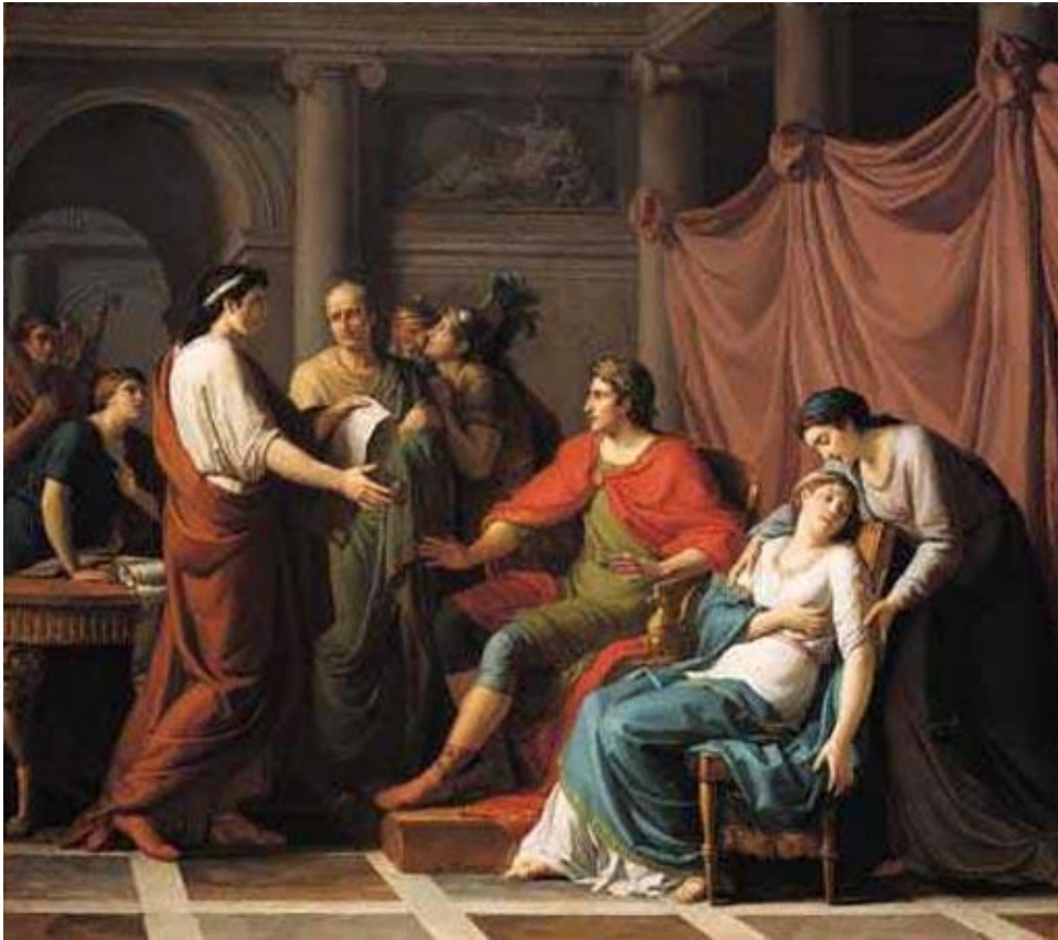
Vergilius läser Aneiden för Kejsar Augustus

Läs några bevingade ord från Vergilius här: https://sv.wikiquote.org/wiki/Vergilius